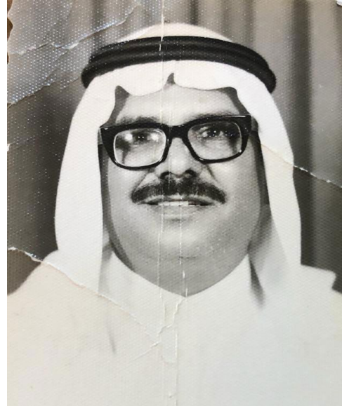
الشيخ محمد الخضير